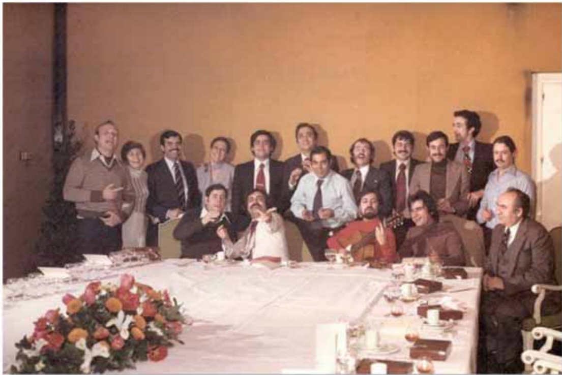
Los CE's en el grupo DR CE Madrid I premiados con "IBM = Service" 1979 con sus "madrinas"