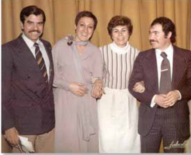
Grupo CE DR Madrid 1979